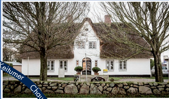
Keitumer Chaussee 10, 25980 Westerland

BRUNS & MÖLLENDORFF GMBH & CO. KG • Waidmannstraße 19–23 • 22769 Hamburg • Telefon: +49–40–8531470 DEPENDANCE SYLT • Keitumer Chaussee 10 • 25980 Westerland Sylt • Telefon: +49 – 4651 – 83 53 400 www.bruns-moellendorff.de • E-Mail: info@bruns-moellendorff.de